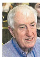
Peter Doherty, Medizin-Nobelpreis 1996